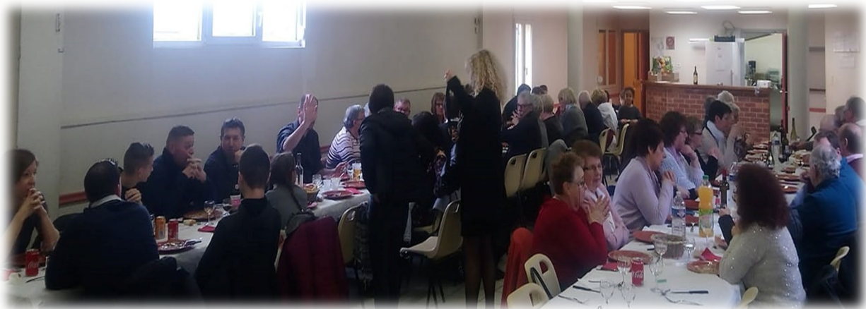
31 mars 2019 : Soirée Couscous/Paëlla