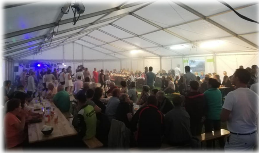
Très bonne ambiance pour le traditionnel feu de la Saint-Jean.