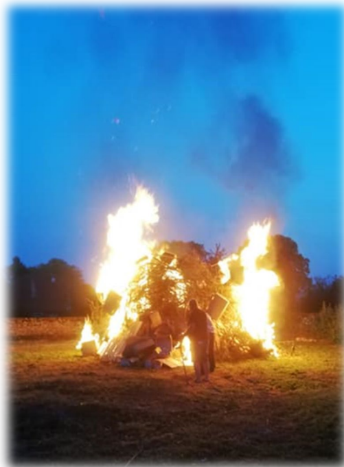
Marcel Bonnetier fidèle au poste pour allumer le feu