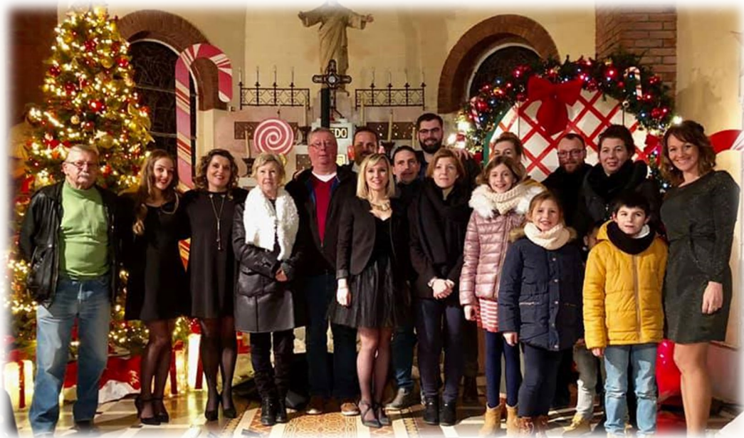
23 décembre 2018: arbre de Noël