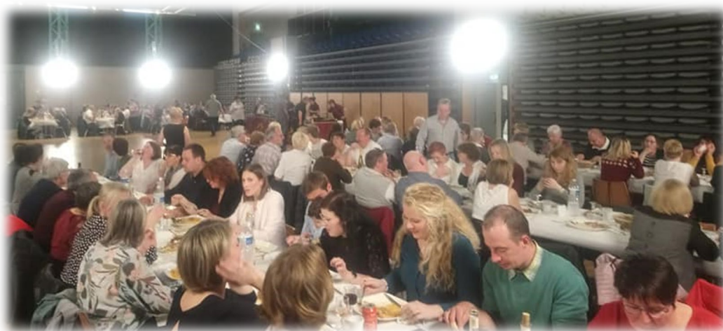
Samedi 22 juin : Feu de la Saint-Jean